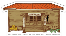
旧光頭寺の建物とキタキツネ、クマガラをモチーフにしたオリジナルステッカー