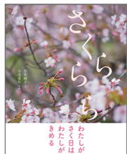
朱鞠内にある一本の桜の木について描かれたすてきな写真絵本