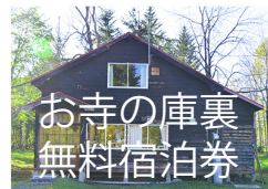
あなたもいつか朱鞠内へ足を運んで、光頭寺の庫裏(くり)でゆっくり足を伸ばして下さい。