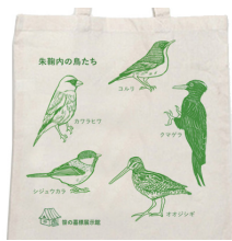
朱鞠内へ毎年訪れるかわいい鳥たちをあしらったオリジナルエコバッグ