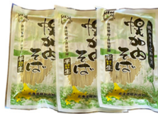
幌加内町も同時に応援! 美味しい半生幌加内そばを大晦日にあわせて発送します。